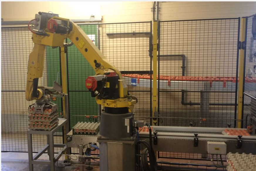
ROBOT JUNIOR SE23