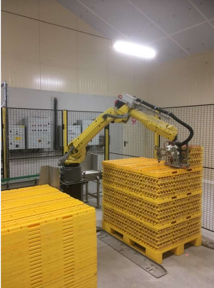
ROBOT JUNIOR AE 40