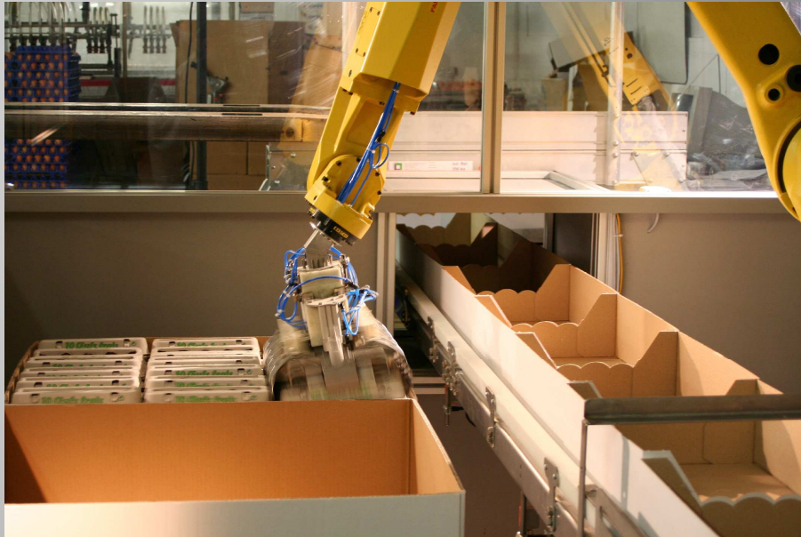
FOTOGRAFÍA NO CONTRACTUAL

ROBOT PARA LA COLOCACIÓN EN CAJAS DEBANDEJAS Y ESTUCHES (ESTUCHES DE 12 HUEVOS o 2 x 6 HUEVOS O 10 HUEVOS) (Todo tipo de estuches de huevos e insertos)